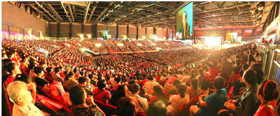
2014年香港30000人弘扬佛法大型演讲会