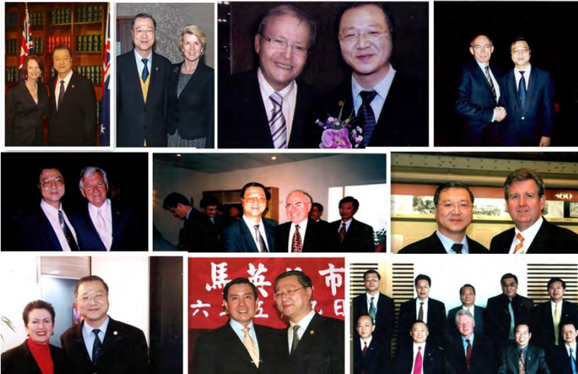
◇ 卢军宏台长与澳大利亚总理、部长、台湾地区领导人马英九、美国总统克林顿等合影

事，做任何事情都要符合真理，这就叫正见。”深谙中华传统文化的卢军宏台长，这样看待和平共赢：“这个世界上，要尽力使你的每个对手都变成朋友，友爱、和平和宽容才是人类最可贵的财富。”这，正是中华传统文化和合之道的精彩之处。