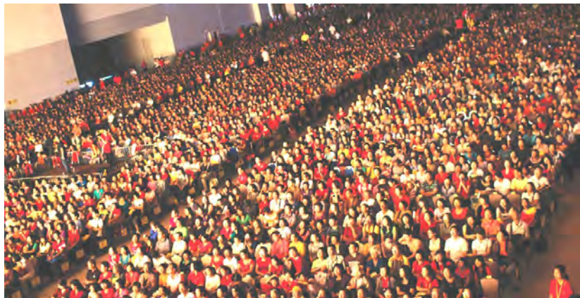
◇ 2013年马来西亚20000人弘扬佛法大型演讲会

子、各界精英，正是因为新中国的强悍雄壮，一扫百年孱弱病夫形象而心生自豪、意气风发。多年来，在世界各地奔走呼吁和平理念的卢军宏台长，虽然身在海外，始终心系祖国，他殷切的盼望“中国梦”早日实现：“家庭和睦，社会稳定是实现‘中国梦’的一个基础，只有身心得到健康，尤其心理上健康了，才会得到更多的祥和，人与人之间的关系只有祥和了，融洽了，国家和政府少了来自民众的抱怨，‘中国梦’才会得以实现。因为‘中国梦’是中华民族追逐的一个理念，中华民族的自强自立和团结，全世界海外华人的团结，才能实现‘中国梦’，这个梦的实现需要全世界华人无私的奉献，奉献就是慈悲，无缘大慈，无缘无故无私的去帮助别人，帮助国家，让中华民族更加强盛，这个梦很快就会实现。我深爱着我们的国家，深爱着那片抚育我成长的土地，我会以自己的能力，配合国家做更多的贡献，尽我所能，做促进中华文化与世界沟通的桥梁！”