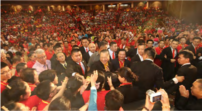
◇ 2015年马来西亚沙巴万人弘扬佛法大型演讲会

音，看过或亲身参加过台长弘法大会的人都会相信，而且丝毫没有怀疑台长所具有的慈悲心！台长无论在博客上，还是在广播中，抑或在法会上，用我们现代人所能听懂的话语，将菩萨道娓娓道来，为众生看图腾，看出众生肉身上的痛苦所在，并告诉我们用什么具体的方法来消除我们肉身上和精神上的痛苦，这就是台长的慈悲心！每次开法会看图腾透支到大汗淋漓，这三年瘦了四十多斤，台长为了众生日夜兼程、不顾一刻休息飞往世界各地弘法度众，在电台也是通宵达旦不顾休息和身体，更让人敬重的是，台长是不要钱的帮助人看，而且，这种免费行为已经坚持了十几年。试想，他每天除了处理电台的正常工作事务，其余所有时间就是免费给人看病看命，而且每周还坚持八个小时之久的直播节目中免费为人看图腾，无私助人，世上除此一人，还有人能找出第二人吗？台长沙哑的嗓子告诉我们一定要念诵大悲咒、念诵心经，一定要断恶修善，孝顺父母，爱国爱家。试问，普