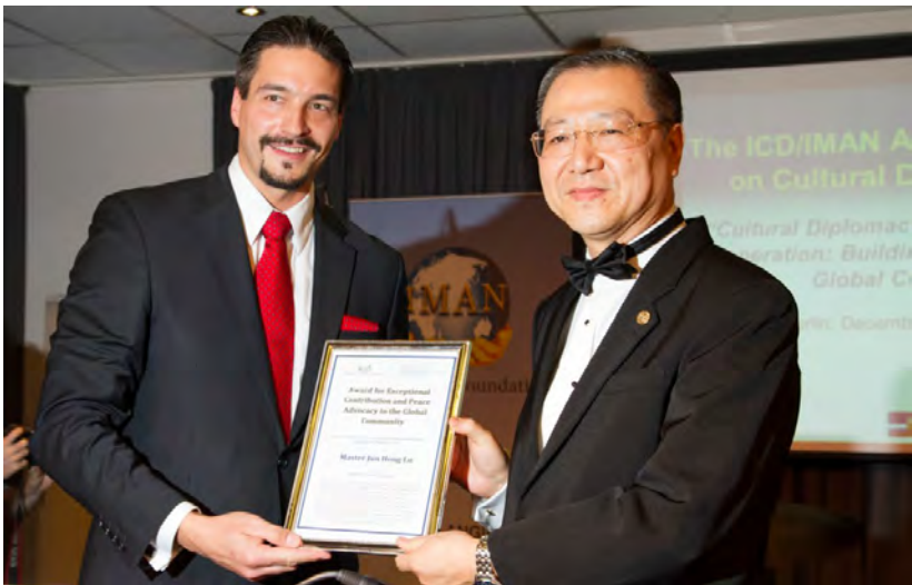
◇ 2013年德国柏林“全球文化外交峰会”授予“世界和平杰出贡献奖”