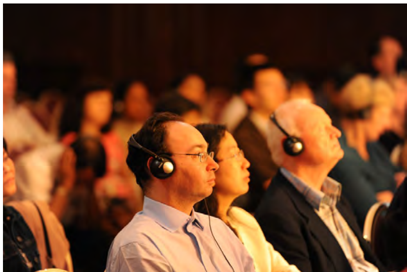
◇ 2012年英国伦敦大型弘法演讲会

“我们比历史上任何时期都更接近中华民族伟大复兴的目标，比历史上任何时期都更有信心、有能力实现这个目标。”习近平总书记观察到这一伟大的契机正越来越近，作为千千万万中华儿女的一员，我们难掩激动和自豪，我们有幸生逢一个伟大的时代，我们坚信，在英明的习主席的领导指引下，我们优秀的中华儿女和海外的炎黄子孙，必将攀登在世界之巅；我们优秀的中华文化，必将深刻的影响造福全世界；我们的祖籍国民族，必将如愿实现伟大复兴的中国梦！我们的祖籍国民族，必将如愿实现伟大复兴的中国梦！