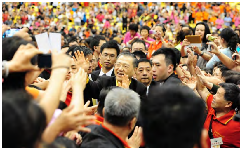
◇ 香港台长受到两万佛友的热烈欢迎

做得好的人一定是一个学佛学佛学得好的人。他说：“学佛就是要好好做人，做人做得好就是学菩萨，人都做得不好学什么菩萨？浩然正气，浩浩乎天地之间，人就是要顶天立地。”特别是他著的《白话佛法》，提倡佛法生活化，教导人们将佛法用在当下生活中改变命运。因其使佛法与生活紧密结合，使众生得以在生活中修行，在修行中生活，极其符合现代社会人们高强度快节奏的生活方式。