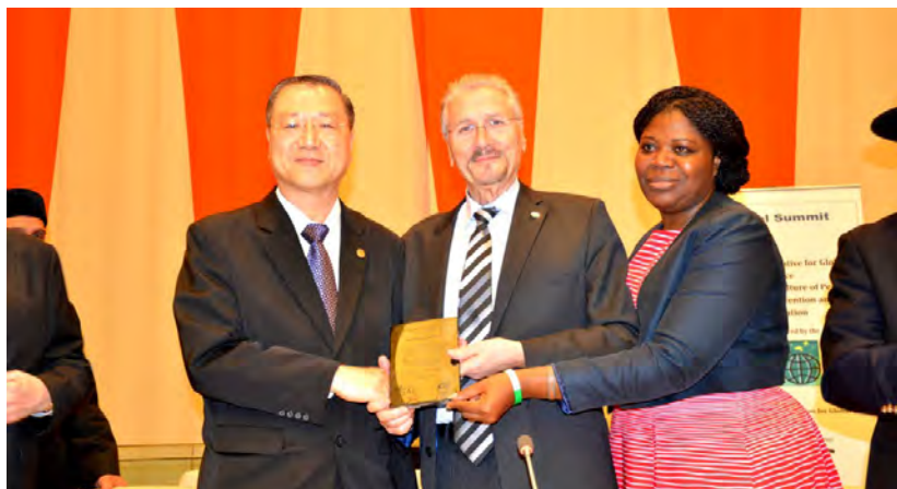
◇ 卢军宏在联合国举办的世界和平会议上获得“世界和平教育大使”

国的安定团结带来不小的负面影响。这些人，这些群体，他们心里没有丝毫可以敬畏的东西，他们没有可以支撑的精神支柱，所以，他们一旦遇到危及到自身利益的时候，就会毅然放弃道德和良心，无法无天，为所欲为，甚至丧失基本的道德底线和做人的良心，干出一些丧尽天良甚至对社会乃至对祖国严重危害的事情。“只要活着的时候法律制裁不了我，死了也没人管了”，这就是现代人的普遍心态。可以说，信仰缺失成了目前一些民众精神空虚、行乱作恶的一大重要原因。