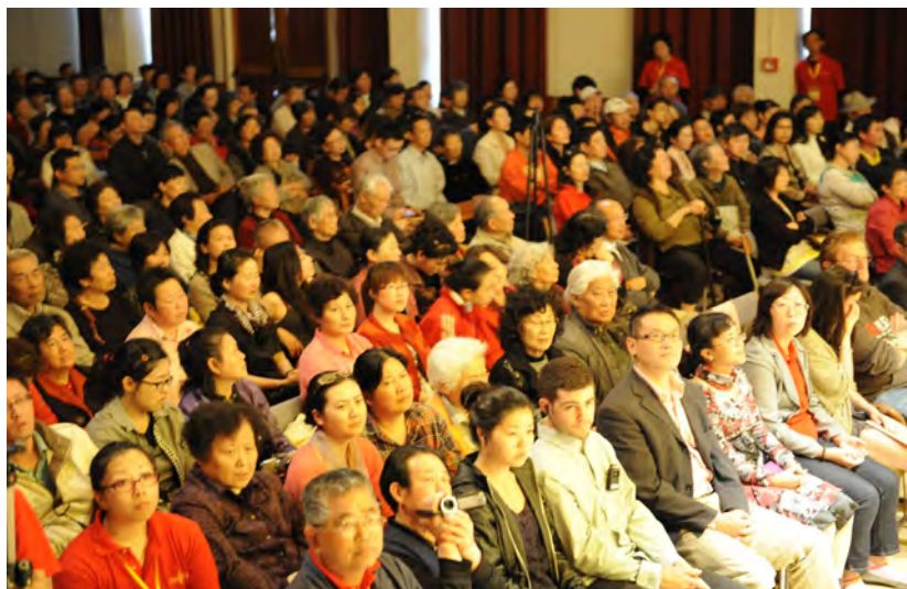
◇ 新西兰弘扬佛法大型演讲会

有人宿世颇有善根，可惜却以研究哲学的心态来学佛，查找经典，多方论证以求所谓“正解”；也有人把佛法知识皮毛当茶余饭后闲聊话题，点缀生活，自认境界非凡，以期博得别人仰慕赞叹。混淆佛学与学佛，将无端生出种种障