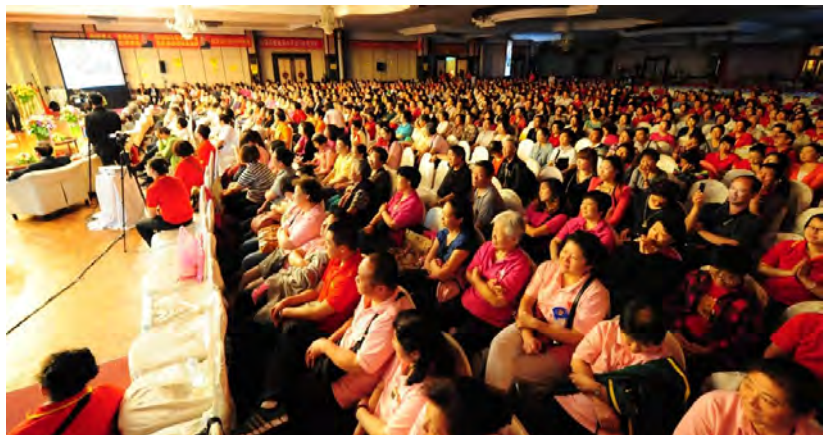
◇ 2013年泰国弘扬佛法大型演讲会