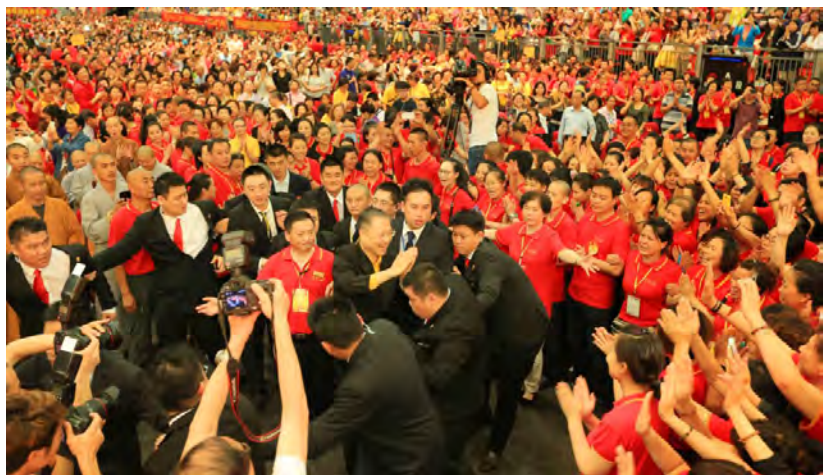
◇ 2013年香港万人弘扬佛法大型演讲会

回望历史，在抗日战争中，中国共产党担当起挽救民族危亡的历史重任，深入敌后，驰骋疆场，成为了中国抗战胜利的中流砥柱；同时，在那战火纷飞的年月，中国佛教界的诸位高僧大德为团结全国人民一致抗战争取最终的和平做出了重要贡献。比如“九一八”事变后，太虚大师号召广大信佛民众要“以菩萨大悲大无畏之神力”，制止日本的侵略行径。与此同时，中国佛教会理事长圆瑛也通告全国佛教徒，以宗教的形式表达爱国抗敌之情，制止日本军阀的侵华暴行。弘一大师、倓虚法师、虚云老和尚、印光大师、巨赞法师、九世班禅等多位高僧纷纷发言表态，一致抗日，为人民独立和国家和平尽心尽力。要知道，中国大乘佛教有着积极