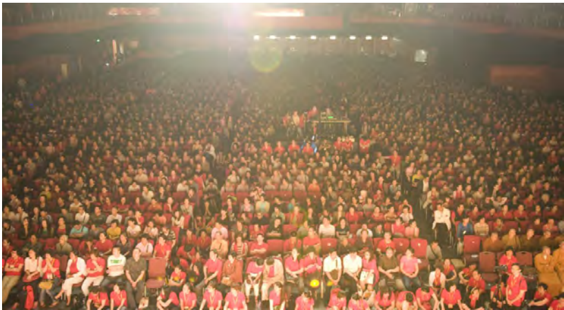
◇ 2012年香港万人弘扬佛法大型演讲会

践行“人类命运共同体”，中国的担当，更是实实在在的行动。大到两带一路、亚投行的建设，小到尼泊尔地震、也门战事的援助国际友人；从为促进地区和平、稳定、繁荣，到灾难面前互相扶助，中国，为促进世界各国各地区实现和平发展共同发展，展现出了让世人为之一振的胆识和气魄。2015年4月22日在亚非领导人会议上，习近平发表了