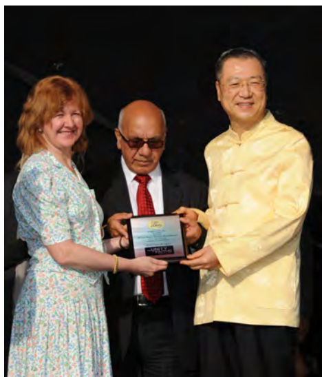
◇ 2012年英国伦敦世界宗教联合会 “世界和平奖（佛教）”

而心灵法门恰恰填补了这两项空白，台长所著白话佛法既具有积极回应现实生活问题的特征，又将浩如烟海的佛教典籍用科学思辨的方法加以提炼，将适用于现代社会的教义，以白话方式与生活中的常见事例结合起来加以诠释，让无数人欣然信受并明理致用，最终弃恶从善。最主要的是，心灵法门做到了上中下三根普被，绝大多数的普通人，他们原本对佛理并没有太多的了解，甚至还有非常世俗的要求，对此，台长相机采用了大小乘结合、次第成就众生的方法，一是用众生喜闻乐见的方式来弘法，即以所谓看图腾的方式直接道出前因，让人在震惊之余即刻明白因果不昧的天理，