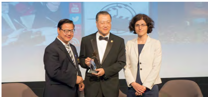
◇ 卢军宏台长在美国宽容博物馆获得颁发“文化和平杰出贡献奖”

实现中国梦，必须凝聚数千万海外华人华侨的力量，依靠大力弘扬中华民族的优秀传统文化。传统文化是民族文化价值认同、民族成员精神联系的纽带。中华文明延续数千年而不衰，中华民族在磨难中日益强大，走向复兴，其重要的价值根源之一，便是对中华民族成员的自觉认同。近年来，海外华人华侨分布地区越来越广，知识、专业层次不断提高，精英辈出，他们促进新兴产业发展，引导外资进入，带动中国企业国际化，推动中国科技创新发展，同时，他们也