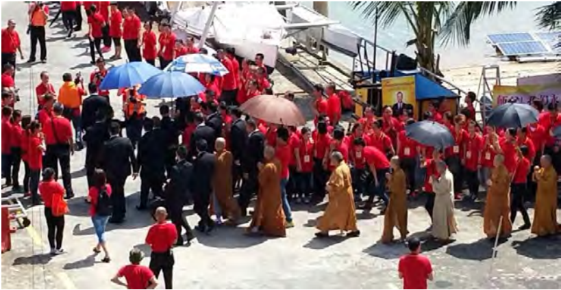
◇ 2014年新加坡卢军宏台长带领法师举行千人放生活动