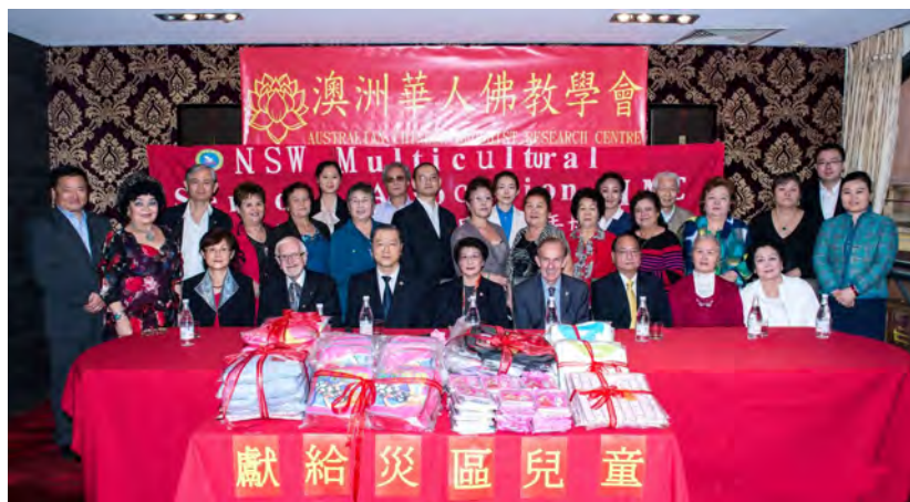
◇ 澳洲华人佛教学会慈善捐赠仪式

他让世界欣赏、体悟、接受中国博大精深的佛教文化，使当代中国精神和价值观为世界所认识和接受。他倡导的心灵法门也肩负着担任国家文化走向世界的和平使者职责，在中华佛教文化与不同文明之间的沟通与交流过程中，传播正法，广结善缘，对推进中华优秀文明走向世界做出杰出贡献。近年来，台长受全世界三十多个国家和地区邀请，举办约五十场《玄艺综述解答会》，弘法足迹遍及欧亚，因此荣获联合国授予文化教育大使、世界宗教联合大会授予世界和平大使、世界和平奖（佛教），以及英国国会上议院颁发的英联邦民族社区特别贡献奖等多项殊荣，并登上了世界学术巅峰哈佛大学的讲坛；卢军宏台长更是受到祖国国家主席江泽民、胡锦涛和李克强总理的接见，并荣登中国新闻出版