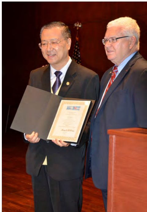
◇ 卢军宏台长在美国国会举办的世界和平会议上获得“世界和平大使”殊荣

充分发现、发扬和发掘佛教的正面、积极、向善的功能，通过大家自发自愿、春风化雨的方式，让断恶修善入住每个人的心中。当前，全世界学习阅读卢军宏所著的《白话佛法》的人逾千万，正是白话佛法所倡导的价值追求、做人之道、道德精神、君子人格等，对于匡正社会风气和教化民众产生了积极的作用。“学佛人首先根据当地的法律，法律认为合法你就做，不合法你就不要做，要记住，骗人的事情不能做；不骗人的事情都能做；赚钱赚过头的事情不能做；对得起良心的事情都可以做；对不起良心的事情不要做。”这段话是卢军宏在2012年10月19日的节目问答中对听众的严肃告诫。诚然，如果世人都有了敬畏之心，那样人人自然都有自律心，昧良心的事很少有人敢做了，社会将更加公平和谐，国家和社会将会更加进步美好，更重要的是，正是基于这种信仰，个人命运前途可以融入到相对“无限”的国家民族发展中，个人的生命可以不再虚