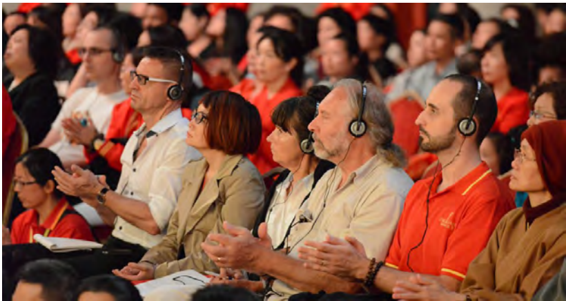
◇ 2015年9月西班牙大型弘法演讲会

真诚希望我们千万不要以一个法门的观点来攻击另一个法门的观点，这样就违背了菩萨的初衷，法门不过是方法，是途径，是随着因缘而产生的方法。八万四千法门，实际上就是菩萨给我们的八万四千条道啊，让我们能够走到彼岸，走到另外一个世界重新的生活，而不希望让我们在这条道上执着，脱不出来。