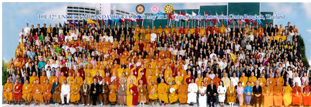
世界和平大使、佛教心灵导师卢军宏台长作为特邀嘉宾出席2015联合国卫塞节庆典活动，与各国政要、佛教领袖大合影