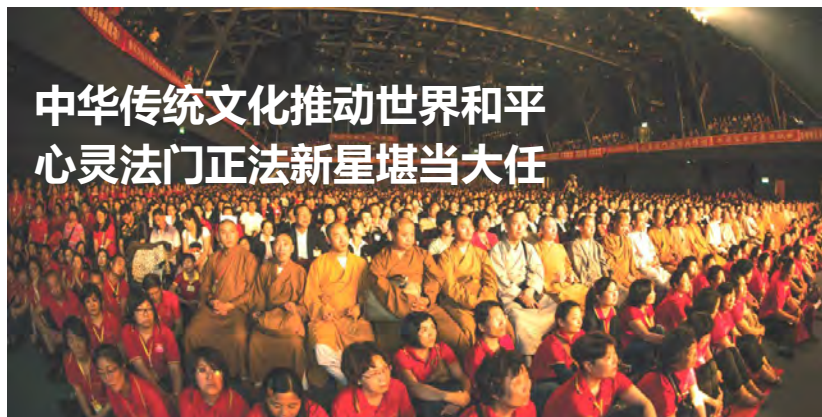
2012年香港弘扬佛法大型演讲会

2015年是中国人民抗日战争暨世界反法西斯战争胜利70周年，不仅在中国，全世界都兴起了一股纪念热潮，全世界热爱和平的人民，都深知这和平来之不易，都想要把这珍贵的和平成果保持和延续下去。