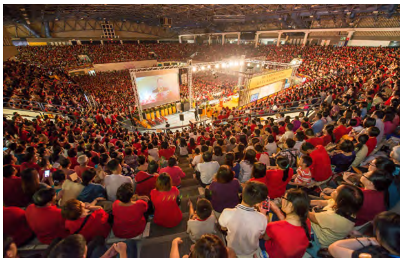
◇ 马来西亚新山万人弘扬佛法演讲会

澳洲佛教协会会长、世界佛教和平奖获得者卢军宏台长倡导以“佛法人间化”的思想，来实现人间思维与行为的佛法化，消弭争端与仇恨，推动世界和平，人类大同。他倡立