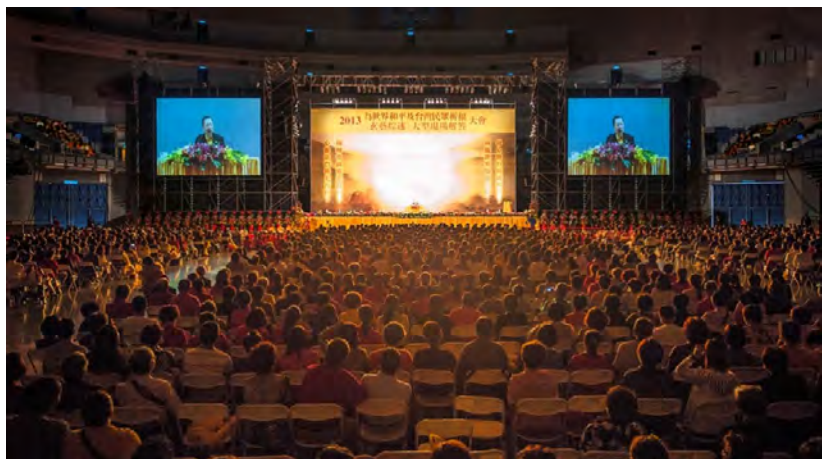
◇ 2013年台湾世界和平万人祈福大会

入世的菩萨道精神，菩萨怎能忍心看众生在战火纷飞之中生命饱受威胁，受苦受难，流离失所？菩萨心就是众生心，为了可以让众生离苦，菩萨可以舍去一切救度众生！从另一角度来说，中国佛教是爱国的宗教，历史上佛教始终把护国作为自己的宗旨之一，把“报国土恩”作为内心修炼的重要内容！正是秉承佛教这一理念，澳大利亚的卢军宏台长，多年如一日，不辞艰险、不怕困难、不顾自己，无私忘我地弘扬中国传统文化和佛教的心灵法门，告诉越来越多的人要明白热爱和平、心灵祥和，用良心做人做事，遵纪守法，更加感恩国家、感恩社会，普及佛教“慈悲”“平等”的观念，同样为维护世界和平做出了应有的贡献。