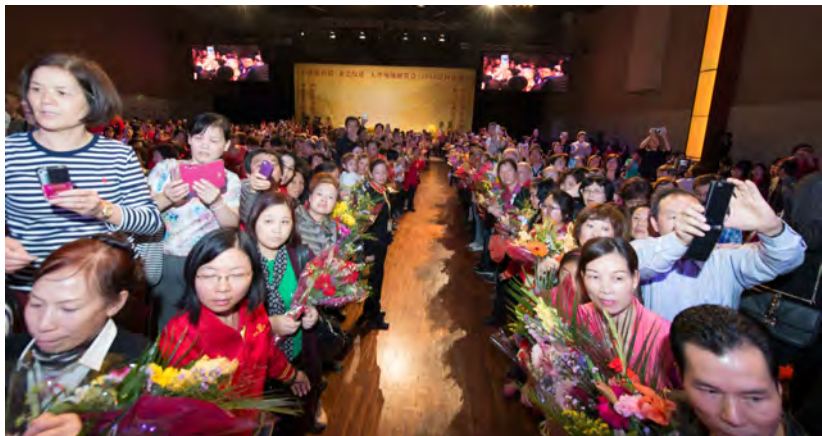
◇ 2015年9月法国巴黎大型弘法演讲会