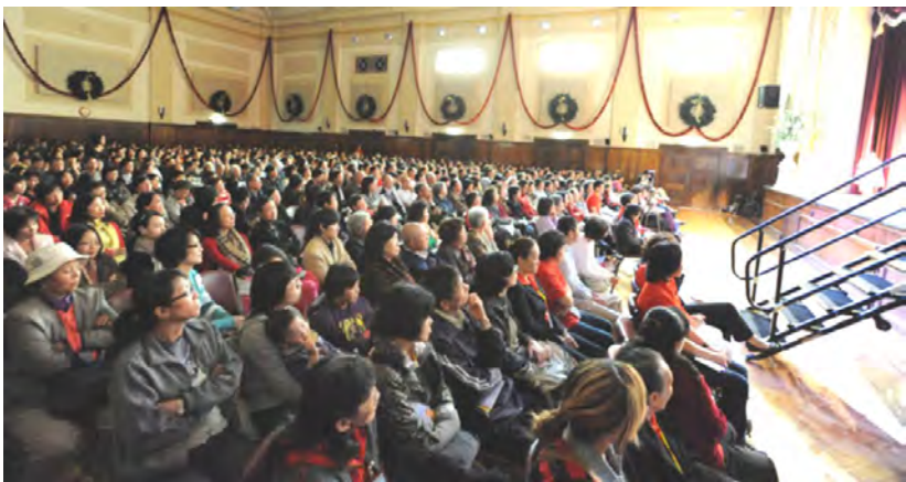
◇ 澳大利亚墨尔本弘扬佛法演讲会

许多人对于佛法，耻于谈及福报，更不屑于在学佛之中求现世功利。其实不尽然，佛法不是不食人间烟火的魏晋名士清谈，求得解脱是无上目标，灭苦获安是现实之道。就绝大多数人而言，灭苦除障之后，才有可能发心精进勤修。生、老、病、死，怨憎会、爱别离、求不得，及一切五蕴之