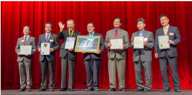
◇ 卢军宏台长在美国洛杉矶获得六市政府授予慈善和平奖项

十多年来，卢军宏和他的弘法团队在全世界奔走相告，创建心灵法门和弘扬白话佛法的发心和愿力，就是要帮助现代人收获心灵世界真正的自在、清净，教化民众要懂得善待他人，要以慈悲心、感恩心在生活中关怀人生、觉悟人生。其方法简单明了，直指人心，就是通过在学习工作之余，积极摒弃不良嗜好，同时通过念经、修心、修行，来提升觉悟，焕发全世界民众爱好和平的本性和良心。可以看到，心灵法门的理念效应，对推动世界和平和谐具有划时代的历史意义！这也是在短短几年之内，全世界学习心灵法门、阅读