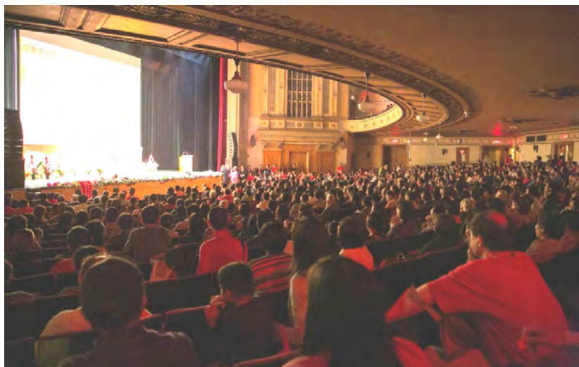
◇ 2014年美国旧金山大型弘法演讲会

从当前来看，建设和谐社会的最大矛盾之一，就是社会道德滑坡。各个国家均存在了不同程度的国民道德缺失而造成的社会不稳定现象。从近年来的毒奶粉、摔死小孩、地沟油、乃至大肆贪污索贿等事件现象来看，均反映出很多的人的心理出现了不健康状况，从一个个事件的负面影响也可以