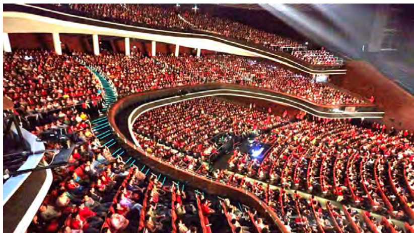
◇ 2014年新加坡万人弘扬佛法大型演讲会

时代呼唤人类爱好和平的本性，时代呼唤人类的良知。如今，当代大德星云法师提出“人间佛法”、卢军宏台长提出“佛法人间化”，其核心期望，就是祈盼用中华传统文化的智慧，教化全世界更多的人热爱和平、心灵祥和，用良心