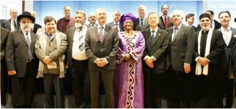
◇ 卢军宏台长在德国柏林参加和平会议与世界各国政要和平人士合影